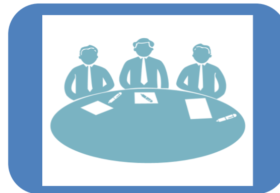
Эксперты (представители экспертной организации)