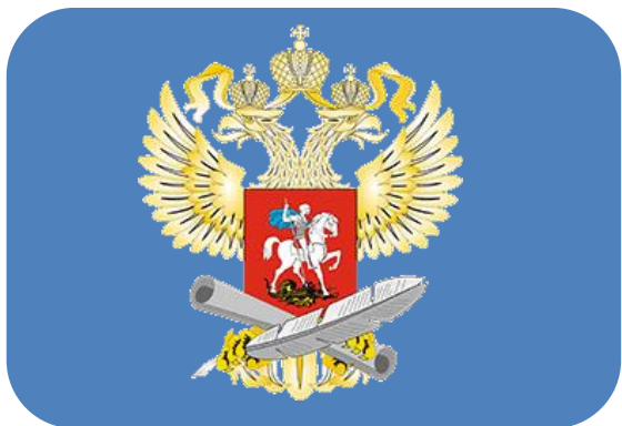
Министерство просвещения Российской Федерации